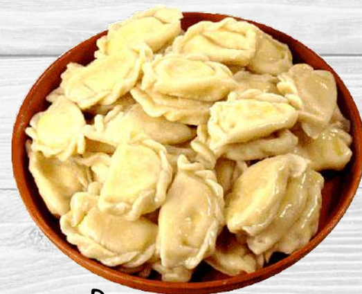
Вареники з горохом